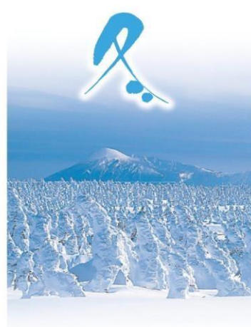
ウィンターリゾート充実の冬 (八幡平の樹氷)

紅葉の秋。樹海ラインから見下ろす景観は、まるで一面点描画のような大パノラマを満喫できる。紅葉を楽しんだ後は、温泉で一息。松川温泉は松川沿いにある山あいのい湯。個性に富んだ露天風呂が、体の芯まで温めてくれる。