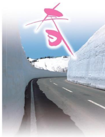
まだ雪深い八幡平の春 (アスピーテライン 雪の回廊)

八幡平市は岩手山・八幡平・安比高原・七時雨山が連なる壮大な自然に恵まれ 豊富な温泉、農 みの り豊かな大地、四季折々の美しい風景は まさに自然からの贈り物と言えるでしょう