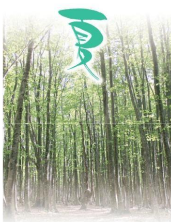
爽やかな涼風が心地よい夏 (安比高原 プナの二次林)

八幡平の春は、ゴールデンウィークを前にした4月下旬の山開きとともに始まる。同時に開通する八幡平アスピーテラインと八幡平樹海ラインでは、雪の壁を両脇に、曲がりくねった回廊をドライブ。この時期のふもとでは桜が咲き、ひと味違った春を満喫できる。