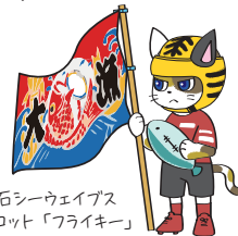
釜石シーウェイブス マスコット「フライキー」